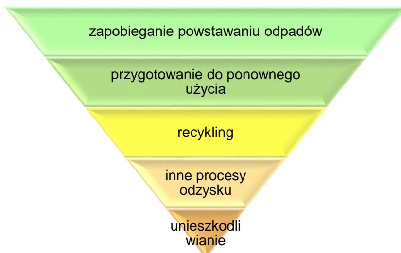
Rysunek 1 Hierarchia postępowania z odpadami [źródło: opracowanie własne]

Powyżej [rys. 1] przedstawiono hierarchię postępowania z odpadami wg art. 4 Dyrektywy 2008/98/WE, która dotyczy postępowania i gospodarowania odpadami. Należy dążyć w pierwszej kolejności do zapobiegania powstawaniu odpadów.