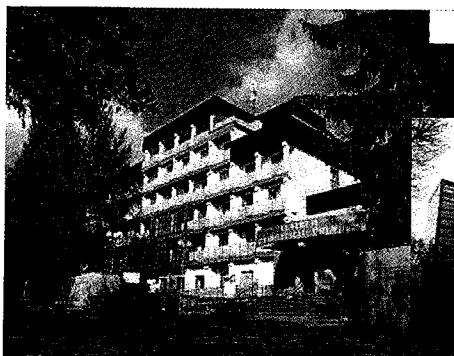
CRR Horyniec Zdrój

Osoby zainteresowane prosimy o kontakt telefoniczny pod nr (23) 674-24-17.