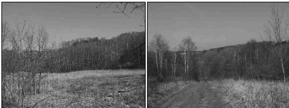
Rysunek 20. Obszar Podkościele